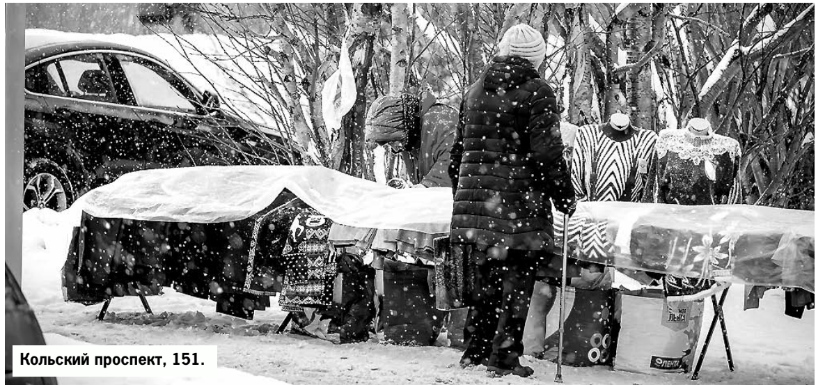
Кольский проспект, 151.

На улице Капитана Орликовой у дома № 15 один из уличных бизнесменов бойко зазывал потенциальных покупателей приобрести его товар. Разложив палатку, мужчина предлагал мясную продукцию. Разрешительных документов у продавца не было, а потому невозможно было установить, откуда на самом деле привезли мясо и безопасно ли оно для потребителя.