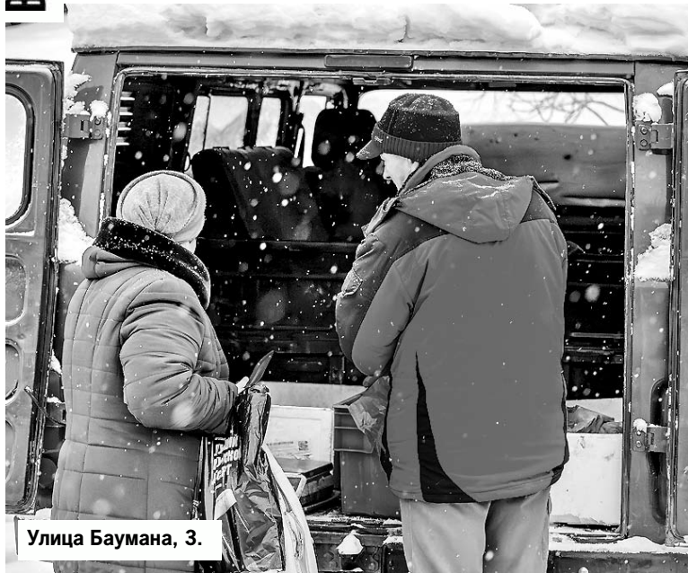
Улица Баумана, 3.

В Мурманске оштрафованы очередные уличные торговцы. Уйти от ответственности им не помогли никакие хитрые планы.