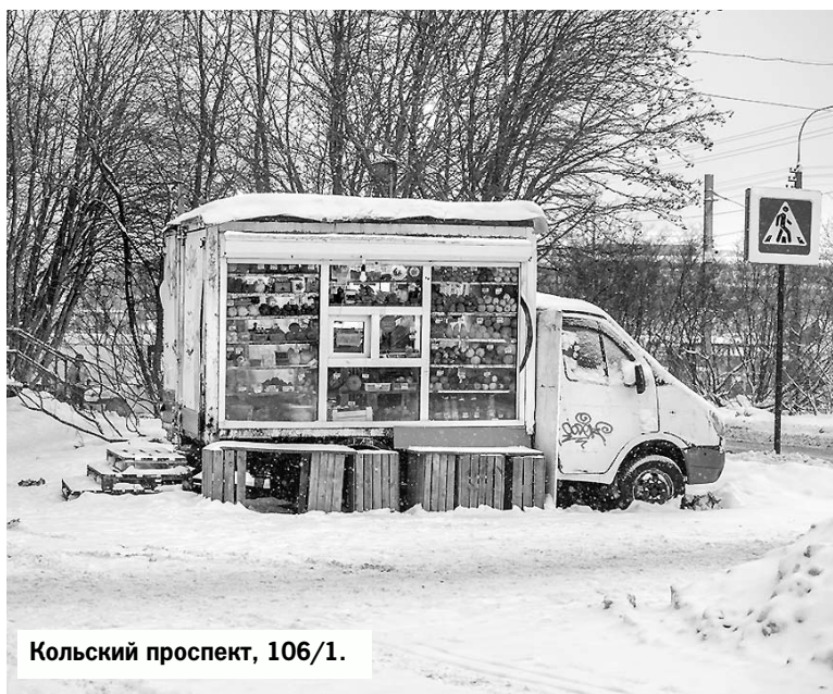
Кольский проспект, 106/1.